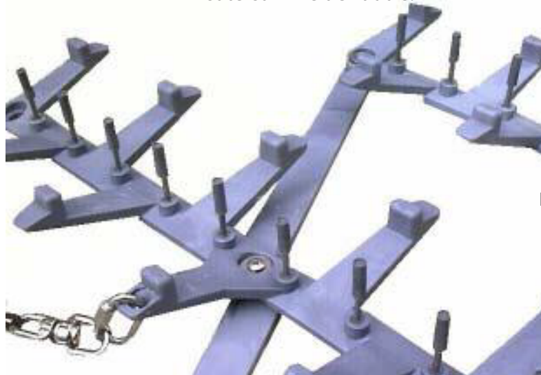
Fig . 3

La herse type HMPC est constituée de pointes aiguisées creuses soutenues par une base de nylon (Fig. 3). La structure basculante de cette base fait que, les pointes s'inclinent au fur et à mesure que la voiture roule par dessus, garantissant ainsi un angle parfait pour une meilleure pénétration. Cette dernière fonction garantit que le dispositif soit aussi efficace d'un côté comme de l'autre.